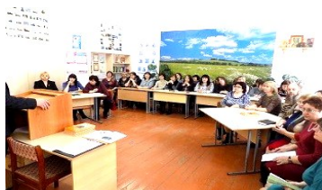
Заккрытие Недели духовно-нравственной культуры

Родительская общественность стала активным участником внеклассных мероприятий (непосредственно участвовали в конкурсах, проектах, были в составе жюри и т.п., являлись членами оргкомитета), так и пассивными (читать информационные стенды, знакомиться с итогами каждого дня, фотоматериалами). Партнеры получили опыт взаимодействия в вопросах духовно-нравственного воспитания.