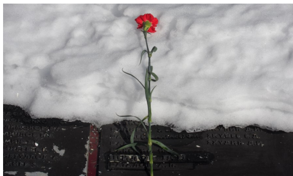
Ца- ка, са