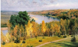
2.В. Поленов «Золотая осень»