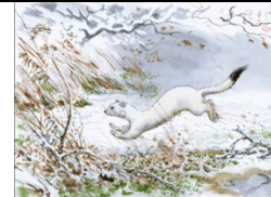
7.В. Горбатов «Горноста́й»