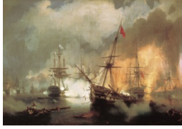
1.И.Айвазовский «Морское сражение при Наварине»