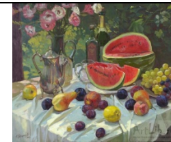
6.А. Левченков «Август»