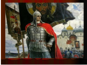
3.Ю. Пантюхин «Александр Невский»